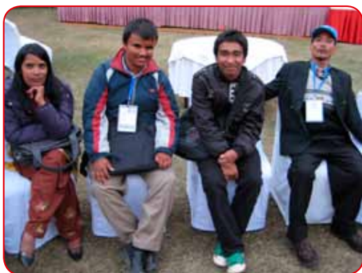
Fire self-advocates fra GFPID på sin første internasjonale konferanse.

I 2012 skal de fokusere på opplæring av det nye styret og utvikling av gode rutiner og systemer for den nye organisasjonen.