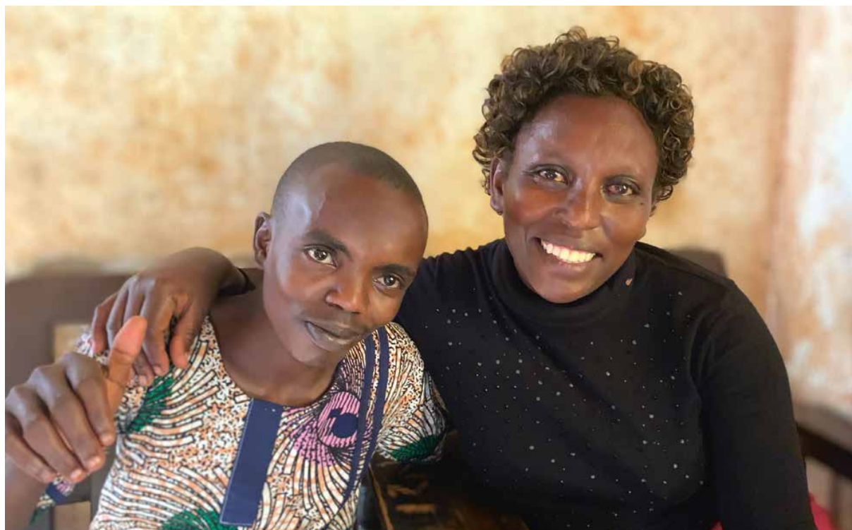
MOR OG SØNN har et nært forhold.

Gruppa baserer seg på likepersonarbeid. De oppsøker familier, gir psykososial støtte og sparer penger til en felleskasse. Enn så lenge har de ikke lært noe særlig om menneskerettigheter, men det er noe de ønsker i fremtiden.