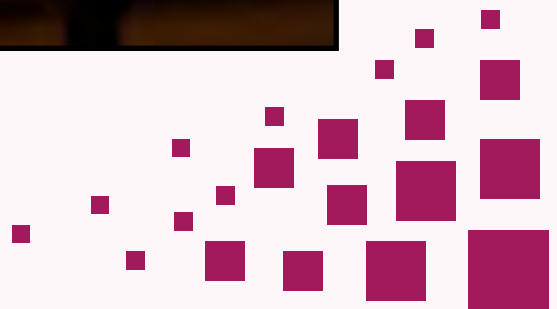
Layout: Even Gauslaa, EMG Media Laget for: Norsk Forbund for Utviklingshemmede, Kristelig studieforbund (K – stud.) og Den norske kirke.